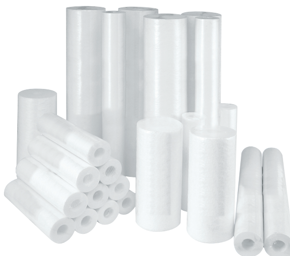
Cartouches de Filtre Melt Blown