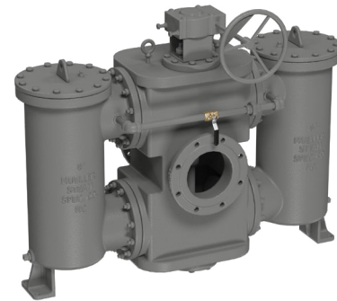
Modèle 691MF SM

Les spécifications des produits Mueller Steam Specialty en unités et en mesures usuelles aux États-Unis sont approximatives et sont fournies à titre de référence seulement. Pour des mesures précises, veuillez communiquer avec le service technique de Mueller Steam Specialty. Mueller Steam Specialty se réserve le droit de changer ou de modifier la conception, la construction, les spécifications ou les matériaux du produit sans préavis et sans encourir aucune obligation d'apporter de tels changements et modifications aux produits Mueller Steam Specialty vendus précédemment ou ultérieurement.